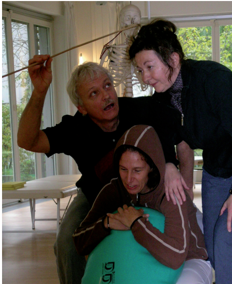
Stoffrepetition mit einer Abschlusspräsentation

Nicht frankieren Ne pas affranchir Non affrancare